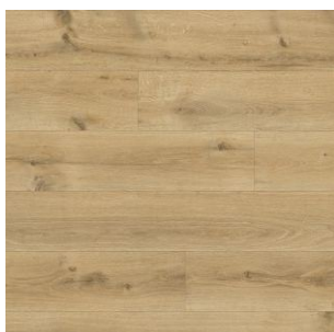
2600 2 / 3 / 4 m