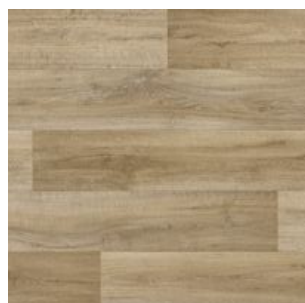
2603 3 / 4 m