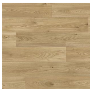
2623 3 / 4 / 5 m