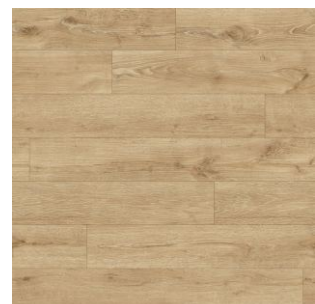
2619 3 / 4 / 5 m