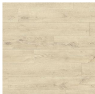
2618 3 / 4 / 5 m