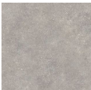
2620 3 / 4 / 5 m