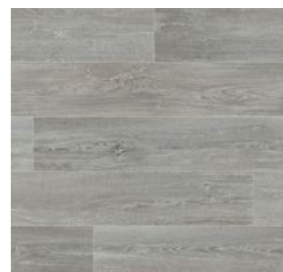
2604 3 / 4 m