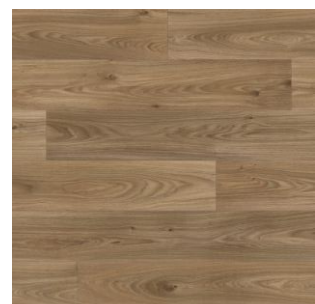
2624 3 / 4 / 5 m