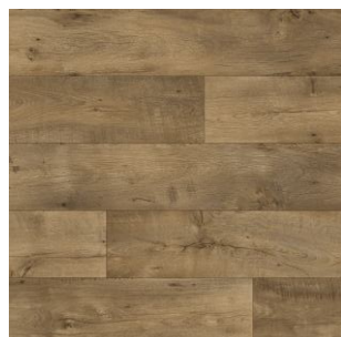
2609 3 / 4 m