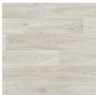
2622 3 / 4 / 5 m