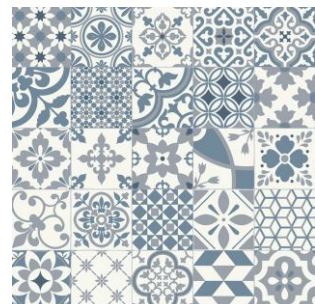
2633 2 / 3 / 4 m