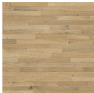
2616 2 / 3 / 4 m