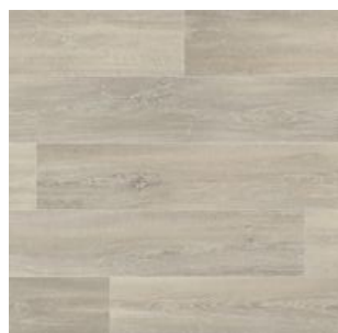
2601 3 / 4 m