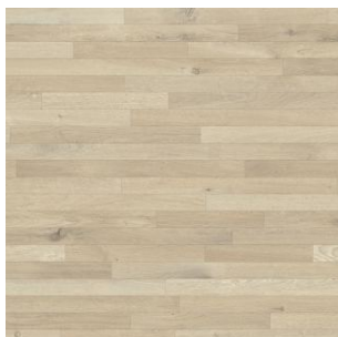
2615 2 / 3 / 4 m